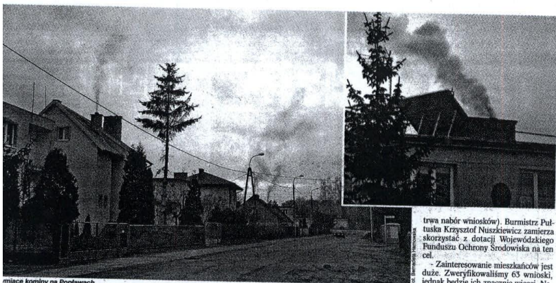
mięśce komliny na Popławach